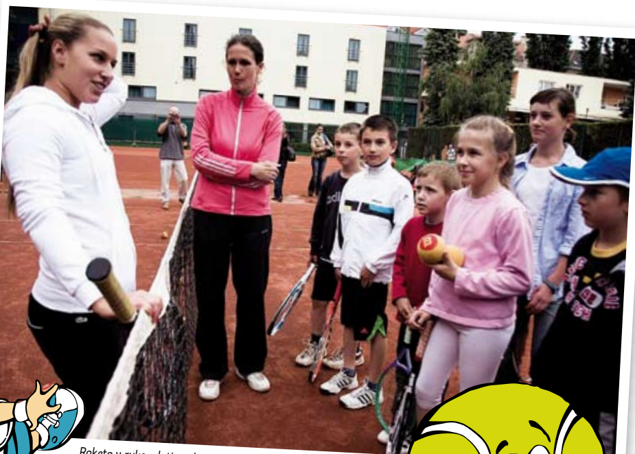
Raketa v ruke a letiaca loptička vyvoláva reakciu a túžbu loptičku odraziť na súperovu stranu. Tak u dieťaťa podporíte radosť z hry.